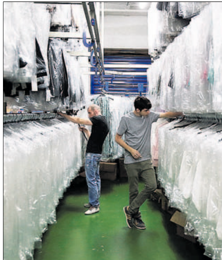
Trabajadores en una fábrica textil en Madrid.

Según explican los autores de esta medición, la curva ascendente del dinamismo laboral "refleja una rotación de los empleados mayor, consecuencia de la firma de nuevos contratos dirigidos a sustituir a trabajadores que, bien abandonaron voluntariamente su puesto de trabajo, o bien fueron sustituidos por la propia empresa para mejorar su eficacia". El estudio, que mide el porcentaje de contratos que han experimentado algún cambio motivado por el reemplazo de personal, incluye las bajas por jubilación; voluntarias o por despido y las modificaciones de contrato.