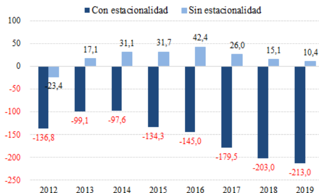
Variación mensual en agosto de la afiliación a la Seguridad Social (miles de personas)