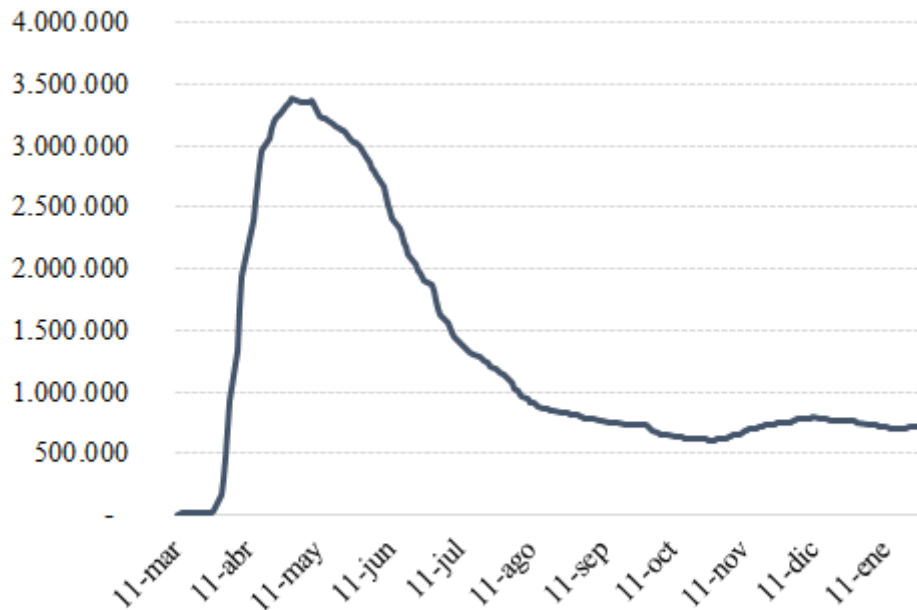
Evolución diaria de ERTE (Expedientes de Regulación Temporal de Empleo) a la Seguridad Social, marzo 2020 - enero 2021